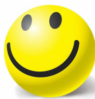
“晴”彩武昌 武昌区珞珈山小学 四(6)班 徐歆伊

这幅作品以“秋”为主题画出了丰收的季节所拥有的金灿灿的美景,画面中的金发少女刻画得十分美丽!金色的仙鹤还有丰收的果实都画得非常细致。