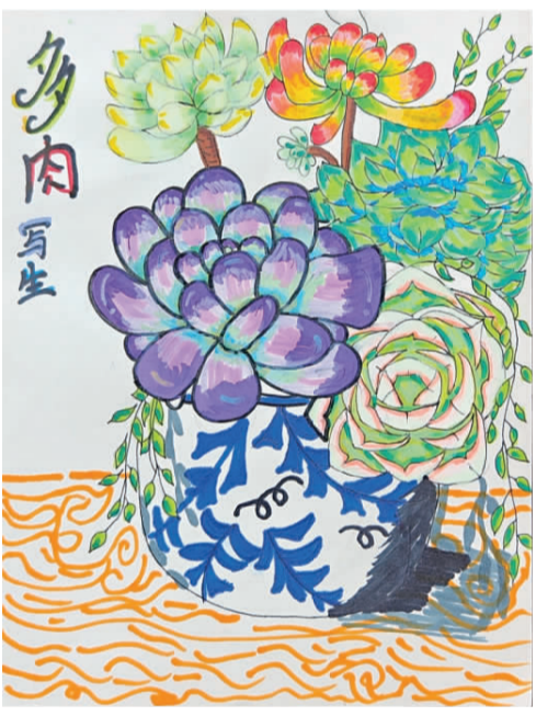
多肉写生 钟家村小学三里坡校区 五(2)班 谢沐恩

这幅作品巧妙地运用了色彩和光影,使得画面中的多肉植物栩栩如生,画中的多肉植物生动活泼,充满了生命力,观赏性极强,让人一眼就能感受到大自然的美丽。