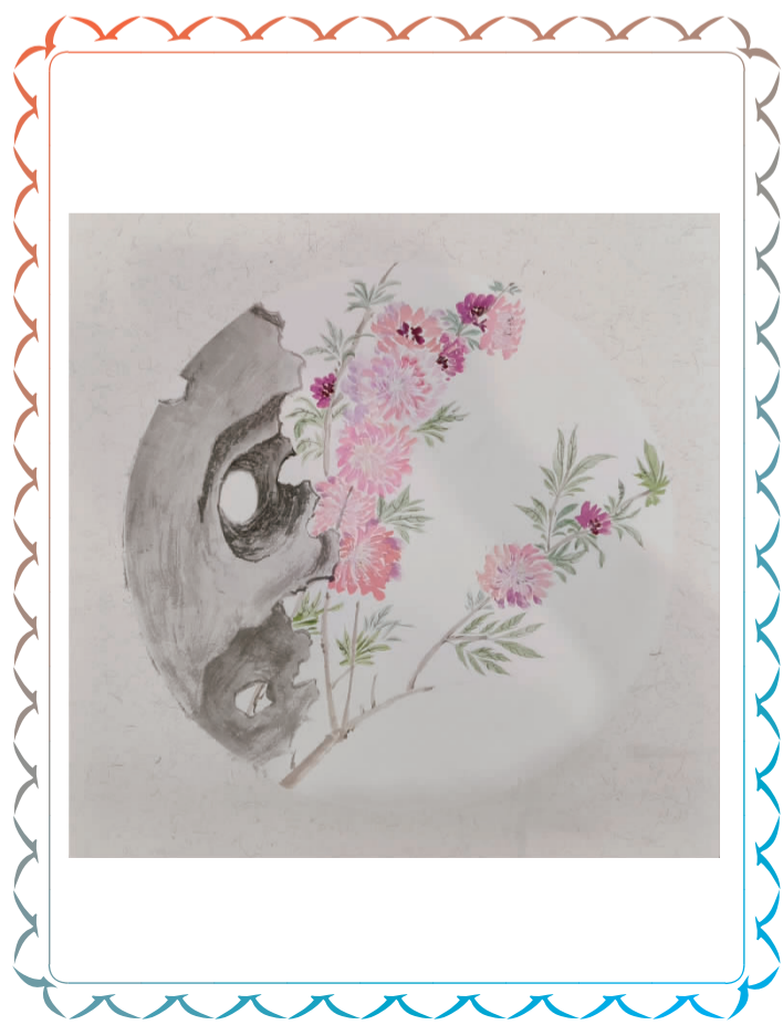
石菊 光谷实验小学 四(8)班 胡诗渔

投稿邮箱：2367458414@qq.com 邮寄地址：武汉市江岸天津路30号《少年科普周刊》 叮叮老师 收