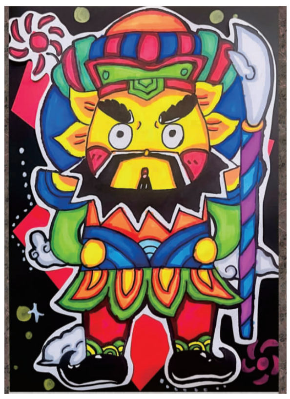
威武的将军 钟家村第一小学 五(5)班 刘祝霖

这幅作品画出了一位威武的将军，颜色对比强烈，将人物的神态、动作都刻画得活灵活现，给人非常强烈的视觉冲击力。