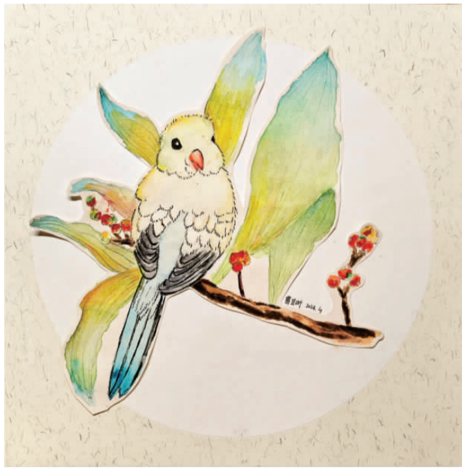
我家的鸚鵡 南湖一小 四(8)班 葛芸昕

这幅作品用剪纸和绘画相结合的形式画出了美丽的精灵少女，粉色的头发搭配蓝色的衣裙，柔和的紫色背景使得整幅画充满了梦幻的感觉。